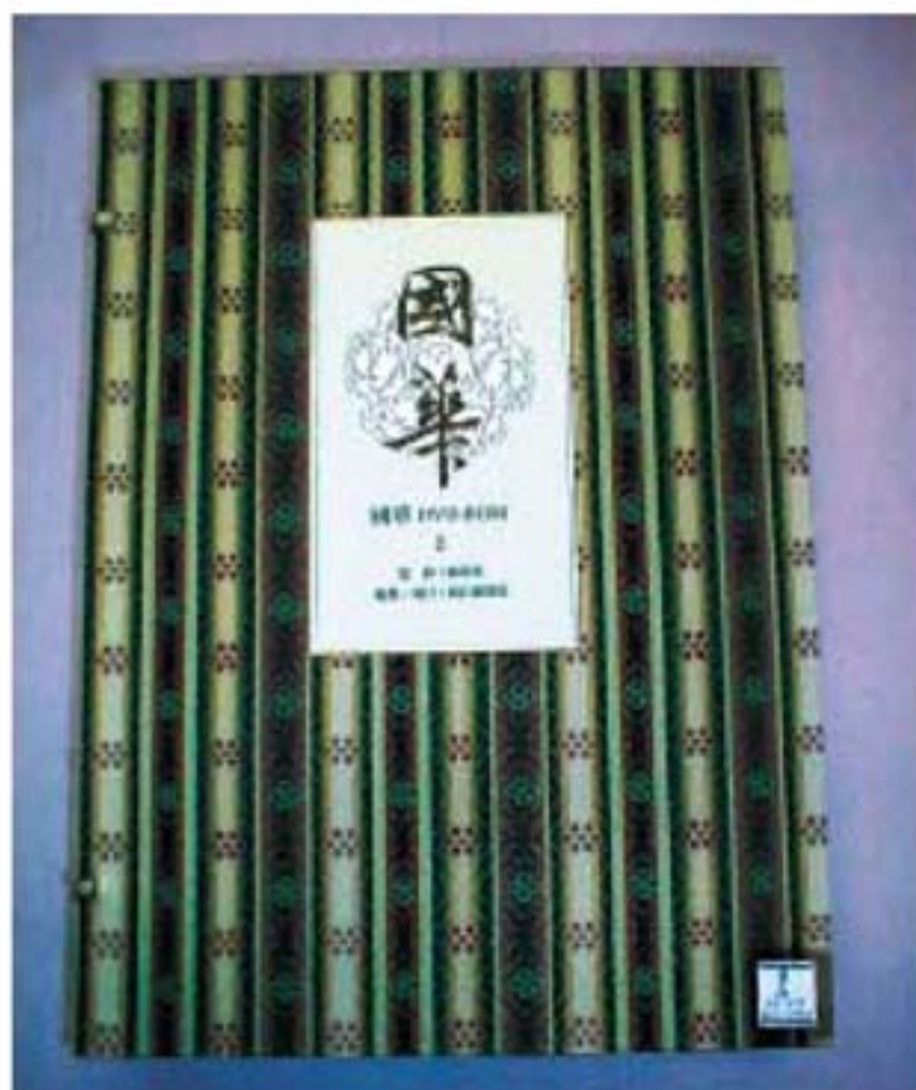
『國華』DVD-ROM 1-2 創刊号(1889年)~1274号(2001年) <本館所蔵>

れている。「美術ハ国民ノ美術ナリ国華ハ国民ヲシテ自国ノ美術ヲ守護スルノ必要ヲ唱導シテ止マサラントス」との文面からもその使命感と啓蒙的姿勢は明らかである。また、そのためには「歴史畫」というジャンルが重要であることも強調されている。つづいて九鬼隆一「国華の発兌ニ就テ」フェノロサ「浮世繪史考」ピゲロー「日本工藝家の注意」岡倉覚三「円山応挙」といった論考を掲載している。「國華」には「歴史教科書」にも必ず登場する美術に関わる人物の名がきら星のごとく並んでいる。ウイーン万博(明治六年)に発するジャポニスムの影響下、西洋のまなざしが浮世絵や工芸品に注目し、「日本美術」のイメージを作り出す一方で、「日本」が主体となって多くの貴重な古美術品の流出を防ぎ、世界に認められる「日本」の「美術」を守り、「美術史」を形成しなければならぬという事情が『國華』の創刊を促したといえよう。